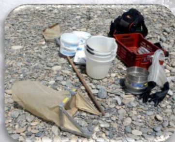
Matériel de prélèvements invertébrés petits cours d'eau