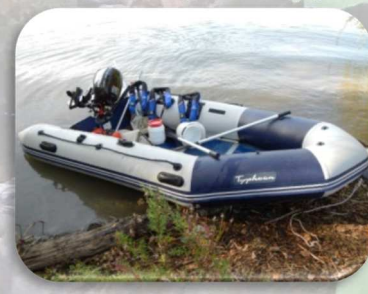
Matériel pour cours d'eau profonds ou plan d'eau