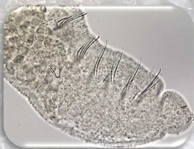
Oligochètes Dero digitata